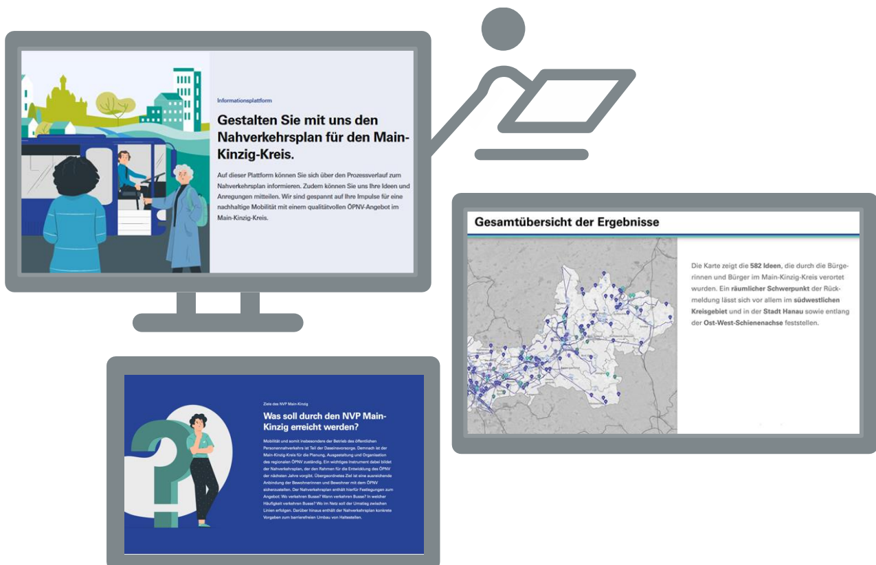
Abbildung 2: Beteiligungsplattform zum NVP Main-Kinzig-Kreis

Ein weiteres mögliches Element des Partizipationsprozesses ist die Öffentlichkeitsbeteiligung, wobei hierfür Online-Plattformen ein beliebtes und leicht umsetzbares Format darstellen (vgl. Abbildung 2). Bei dieser Beteiligungsform werden die Teilnehmenden nach wahrgenommenen Mängeln und weiteren Anregungen gefragt und auf diese Weise die Transparenz der kommunalen Verkehrsplanung sowie die Akzeptanz der im NVP entwickelten Maßnahmen erhöht. Wertvolle inhaltliche Anregungen können insbesondere dann entstehen, wenn der Austausch zwischen Fahrgästen und Verkehrsunternehmen bzw. Aufgabenträger noch nicht regelmäßig durch ein Beschwerdemanagement o. ä. stattfindet oder mit der Beteiligung bestimmte Zielgruppen angesprochen werden.